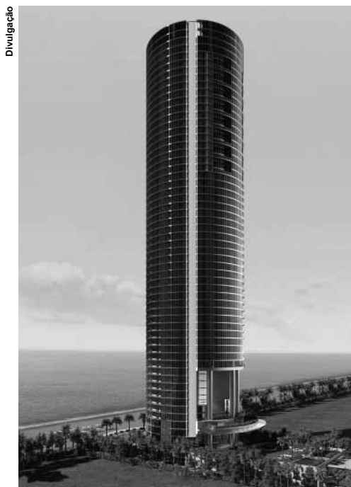
Porsche Design Tower fica em Sunny Isles e os valores dos apartamentos atingem mais de US$ 30 milhões.

Desenhada pela empresa Sieger Suárez e comercializada pela BRG International,